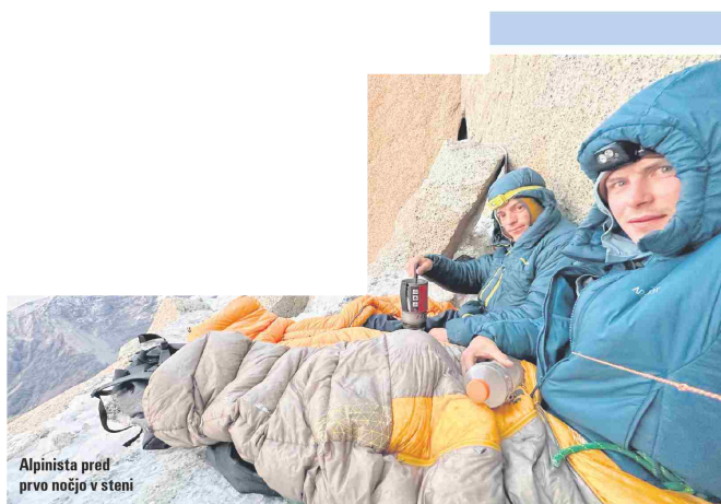
Alpinista pred prvo nočjo v steni